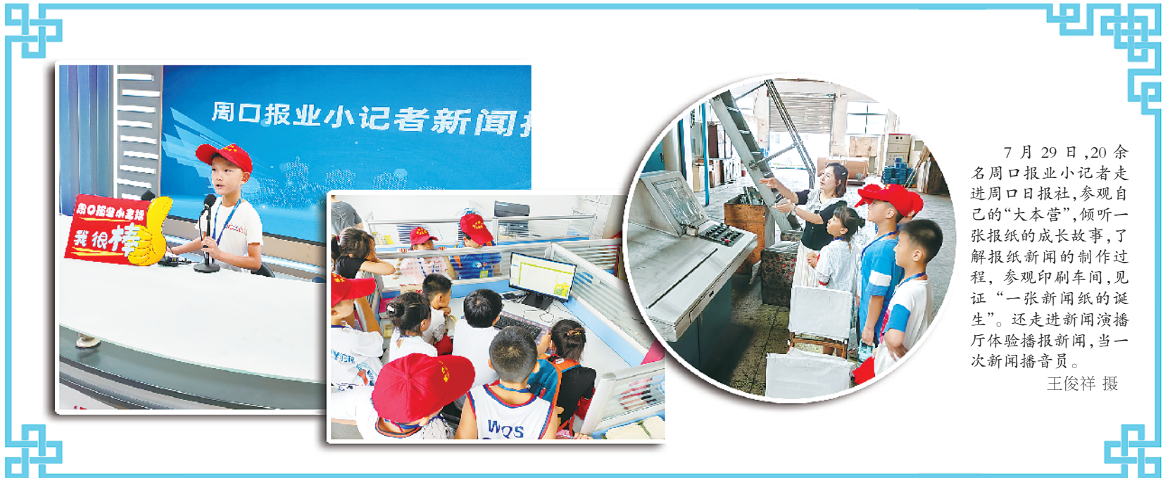
7月29日,20余名周口报业小记者走进周口日报社,参观自己的“大本营”,倾听一张报纸的成长故事,了解报纸新闻的制作过程,参观印刷车间,见证“一张报纸的诞生”。还走进新闻播音厅体验播报新闻,当一次新闻播音员。

纳税服务预约办,让办税“无堵”。该局坚持靠前服务,制定延时服务内部制度,对已到下班时间正在办理涉税事宜或在办税服务厅等候办理涉税事项的纳税人提供延