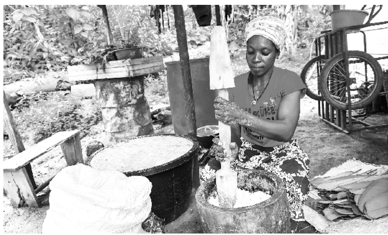
喀麦隆的木薯产业

耿爽表示,国际社会要一视同仁地共同打击叙利亚境内所有被安理会列名的恐怖组织,彻底斩断其武器、人员和资金来源,停止对恐怖势力的纵容、包庇或政治利用。他说,跨境救援是特殊形势下做出的临时性安排,需要加快向跨境救援过渡。国际社会要拿出推动跨境救援的力度,推动跨境救援,努力让叙境内全体民众无差别获得人道资源。