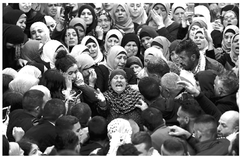
以军在约旦河西岸打死3名巴勒斯坦人

本月2日,美联储宣布将联邦基金利率目标区间上调75个基点到3.75%至4%。美联储将于12月13日至14日举行今年最后一次货币政策会议,目前市场普遍预计届时美联储将下调加息幅度至50个基点。